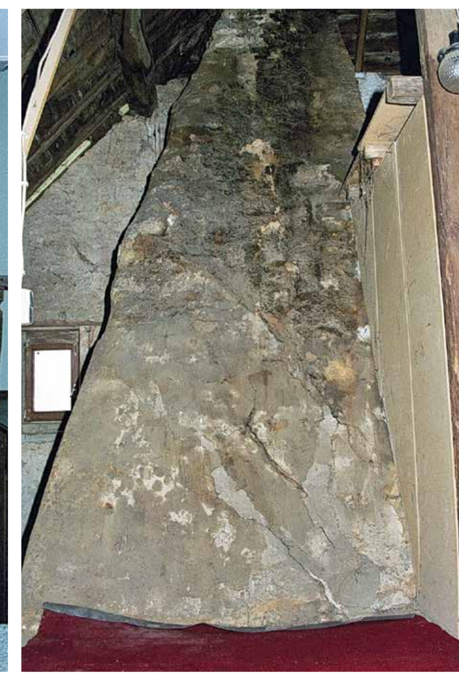
...der Kamin auf dem Dachboden... ...la cheminée du grenier...