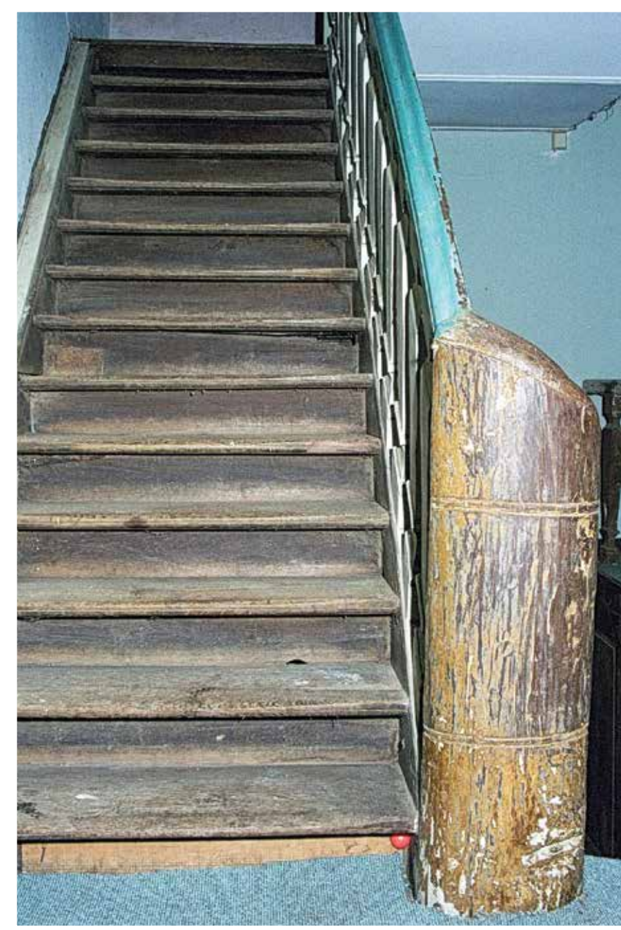
...die Holzterasse zum Dachboden... ...l'escalier en bois menant au dernier étage...