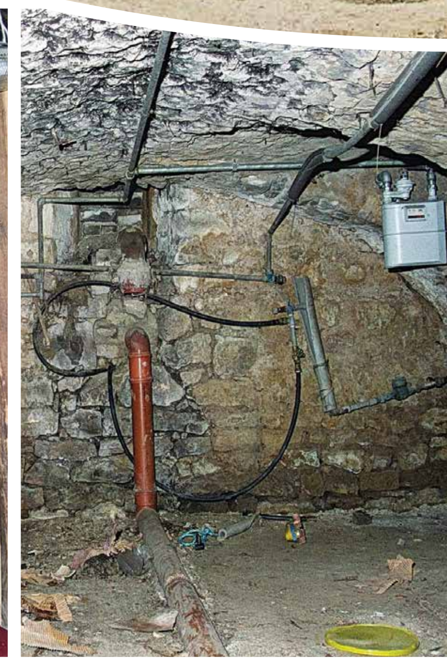
...und der verwölbte Keller mit den neueren Gas- und Wasserleitungen... ...et la cave voûtée avec les nouvelles conduites de gaz et d'eau