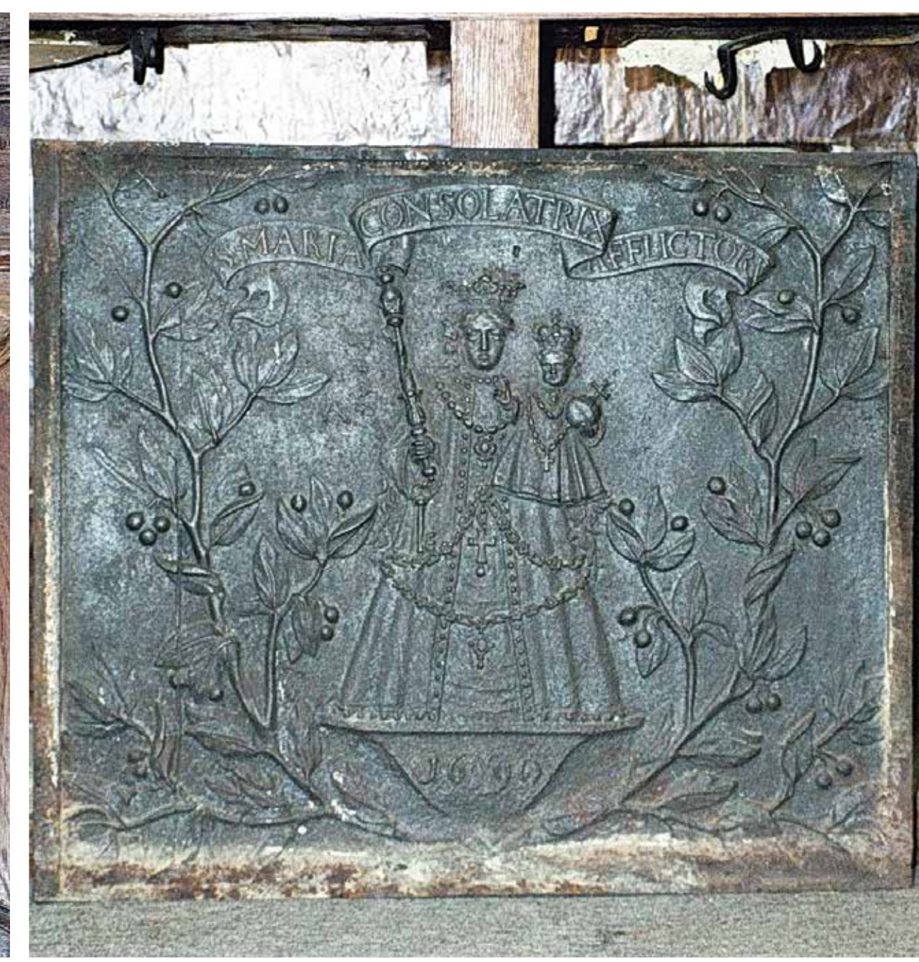
Die alte „Tak“ (gußeiserne, reliefverzierte Kaminplatte) blieb erhalten, wurde aber für die Musikschule durch eine neuere aus der Fonderie Massard (Kayl) ersetzt. La vieille « Tak » (plaque de cheminée en fonte avec relief) a été conservée, mais à l'intérieur de l'école de musique elle fut remplacée par une nouvelle « Tak » de la Fonderie Massard (Kayl).