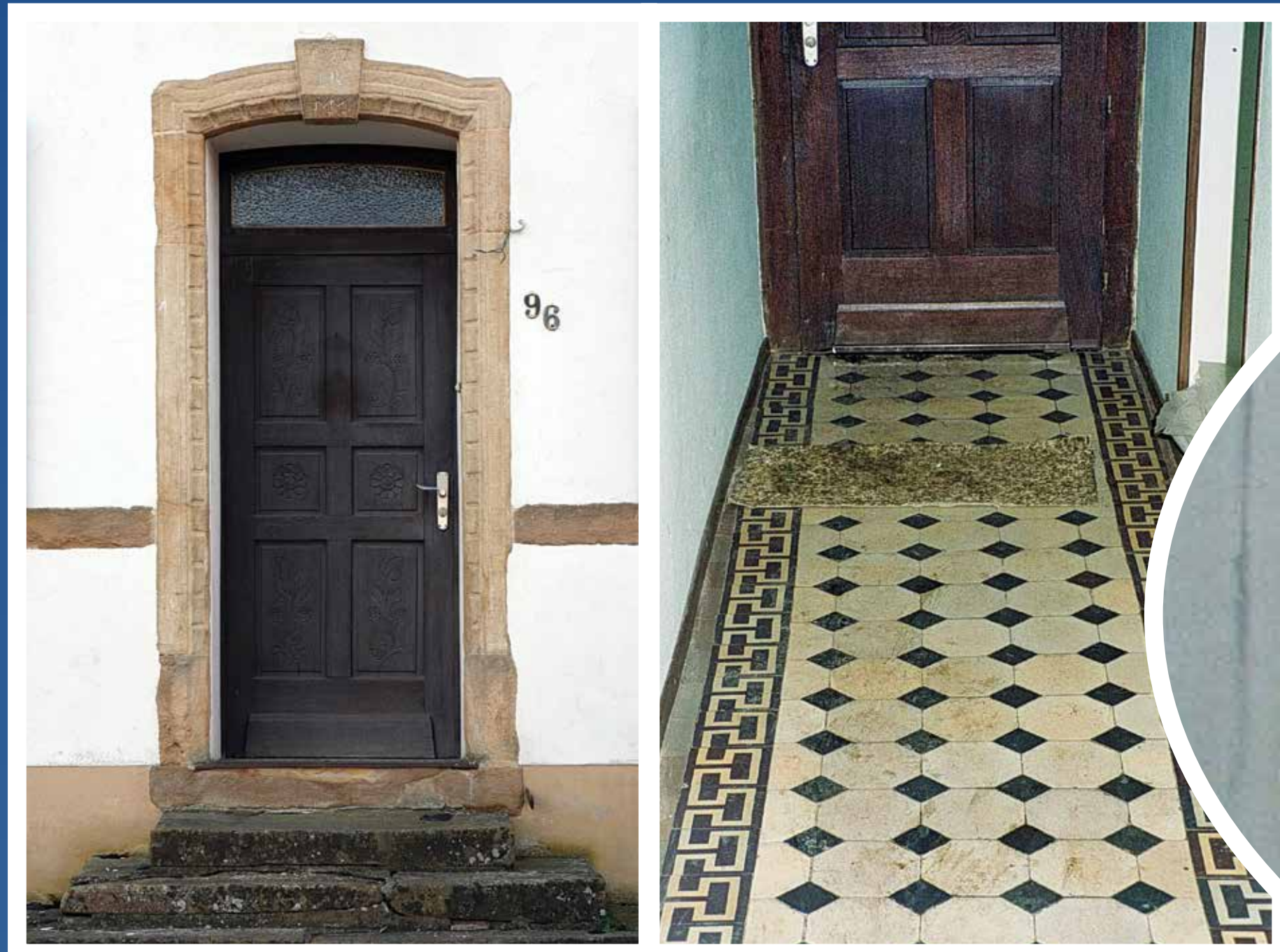
Die Haustür mit dem früheren Eingang zum Wohnhaus... La porte de l'ancienne entrée principale...