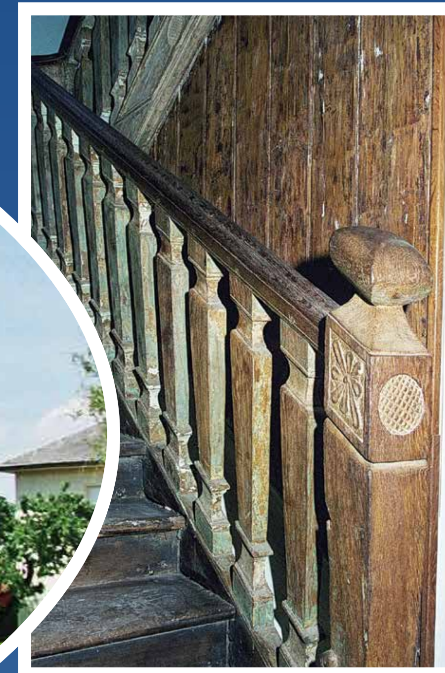
...die Holzterasse zum ersten Stock... ...l'escalier en bois menant au premier étage...