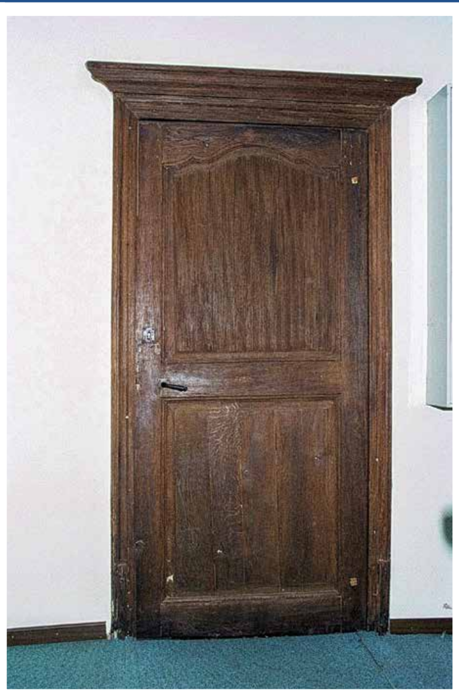
...die Zimmertüren des ersten Stockwerks... ...les portes du premier étage...